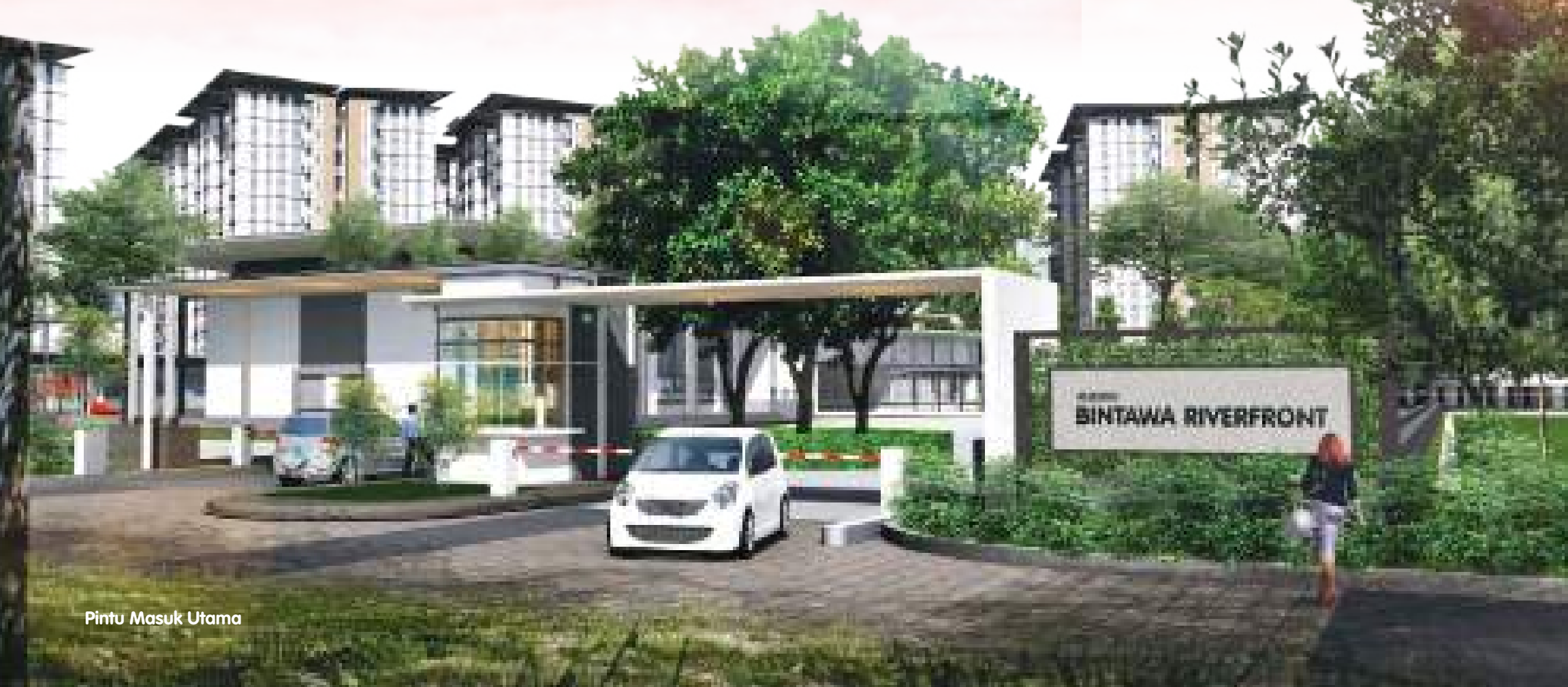
Pintu Masuk Utama