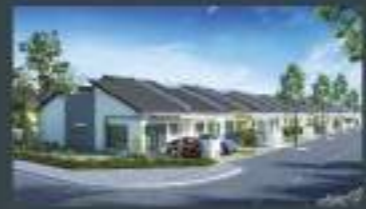
RESIDENSI GAMBANG BARU 1