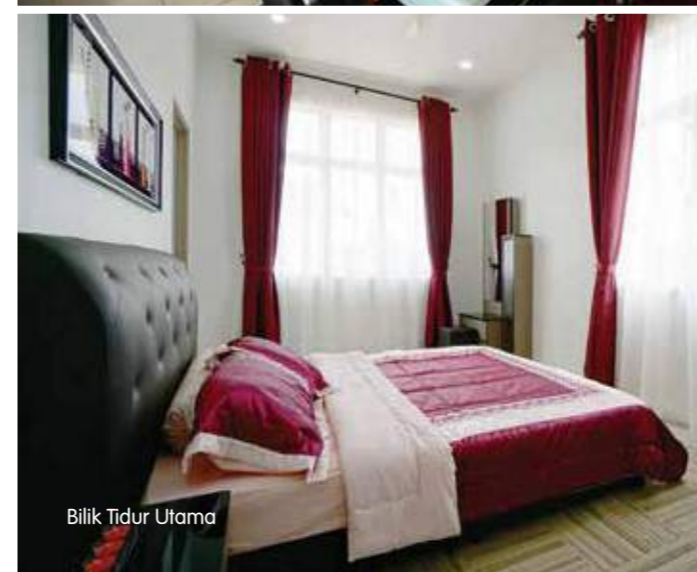
Bilik Tidur Utama