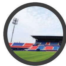
STADIUM TAN SRI HJ. HASSAN YUNOS 4.7KM