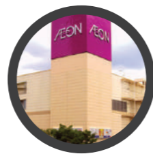
"AEON TEBRAU" 8KM