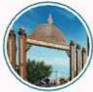
Bandar Kota Bharu