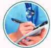
Hospital Universiti Sains Malaysia