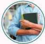
Universiti Sains Malaysia