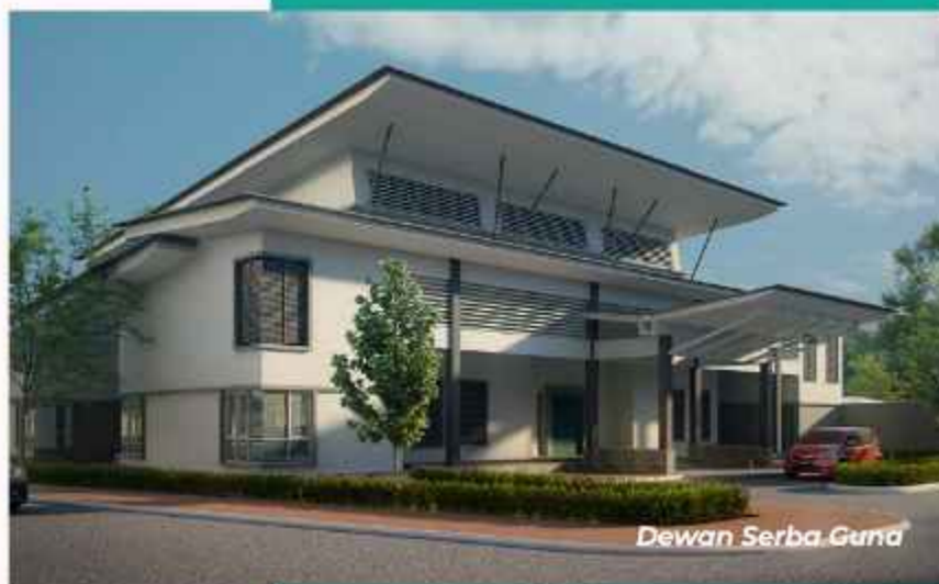
Dewan Serba Guna

Elemen ketenangan, keselamatan dan keharmonian di Residensi Kubang Kerian merealisasikan kehidupan lestari.