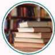
Sekolah Menengah Islam Aman